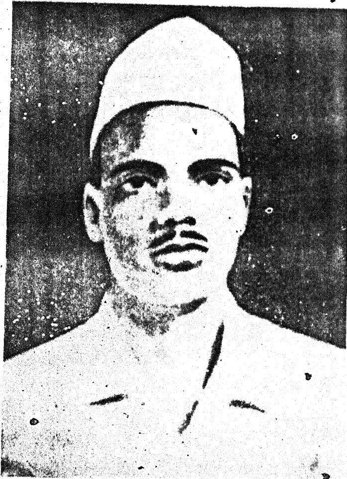
शिवराम हरि राजगुरु